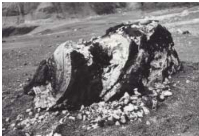
Рис.1. Риолитовая бомба в базальтовой «рубашке». I тип пористости.

породу на клинообразные микроблоки. Большой частью трещины открытые, образованные в результате охлаждения, некоторые из них выполнены белым плотным веществом. Белый налет отмечается иногда и на поверхности крупных пор. Предполагается, что это белое вещество представляет собой гелеобразный кремнезем, который отлагался из нагретой до высоких (порядка 25 0 С) температур воды Карымского озера. Отличительной особенностью таких пемзовых бомб является наличие базальтовой «рубашки» и шлакоподобных включений, которые соответствуют по составу основной массе изверженных базальтов. (рис. 2 на 4-й станции обложки).