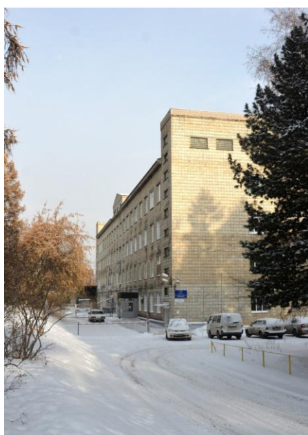
Институт геохимии им. А.П. Виноградова Сибирского отделения Российской академии наук, основан 29.11.1957