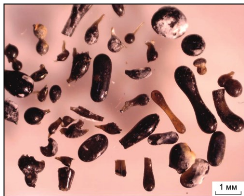
Рис. 2. Частицы вулканического стекла, выделенные из кремнисто-цеолитовых отложений Паужетского геотермального месторождения (скважина R-122). Снимок с использованием цифрового микроскопа Levenhuk DTX 90.

Частицы вулканического стекла выделены из кремнисто-цеолитовых отложений, образующихся непосредственно под зумпфом скважин R-122 и ГК-3 в начале сброса термальных вод. Частицы имеют сильный стеклянный блеск и разнообразную форму: идеальные или неправильные шарики, каплевидные, гантелевидные, овальные с «отростками»-иголочками, сросшиеся уплощенные и др. – самых невероятных очертаний (рис. 2). Цвет стекла от медово-желтого до бурого и черного. На сколах видно, что практически все зерна массивные, но во многих присутствуют пузырьки газа (газово-жидкие включения?). Зерна достигают 2.0\text{-}2.5 \text{ мм} (что наиболее характерно для гантелевидных и игольчатых), но преобладает размерность \leq 0.1\text{-}0.5 \text{ мм} . Из одной пробы выделено более 300 штук наиболее крупных зерен.