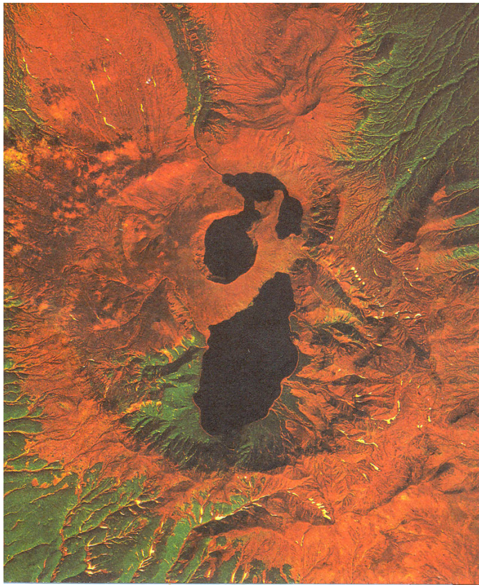
Рис. 1. Кальдерный комплекс Ксудач (вид из космоса). В центре - сложной конфигурации оз. Штюбеля в кратере 1907 г. и озеро Ключевое в кальдере 240 г.

Вулкан Ксудач на Южной Камчатке (точнее крупный вулканический массив с активным конусом Штюбеля) – один из наиболее интересных и сложно построенных вулканических аппаратов на Камчатском полуострове (рис. 1).