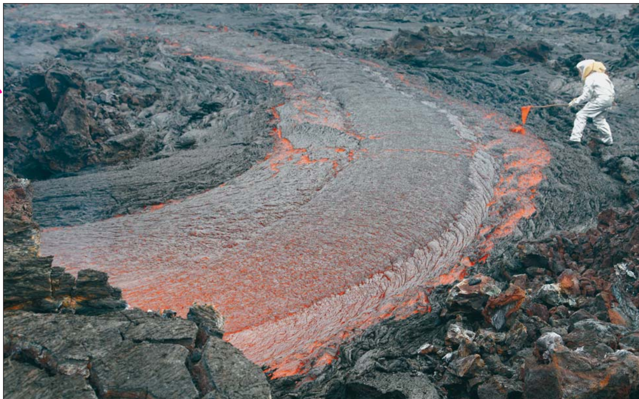
Рис. 6. Лавовая река, выходящая из лавовода в 1 км от активного шлакового конуса. Вулканолог в теплоизолирующем костюме отбирает пробу базальтового расплава. 19 марта 2013 г.