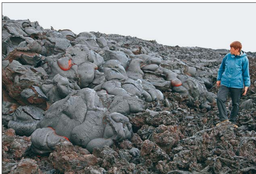
Рис.9. Фронт тюбиковой и кишечной лавы в 3.5 км от активного конуса. 28 мая 2013 г.

В течение лета уровень лавы в лавоводах постепенно понижался, и к концу лета они полностью опустели. Лавовое озеро в кратере конуса Набоко исчезло. В эксплозивной активности кратера наблюдалось несколько пауз продолжительностью до трех дней. Многим казалось, что