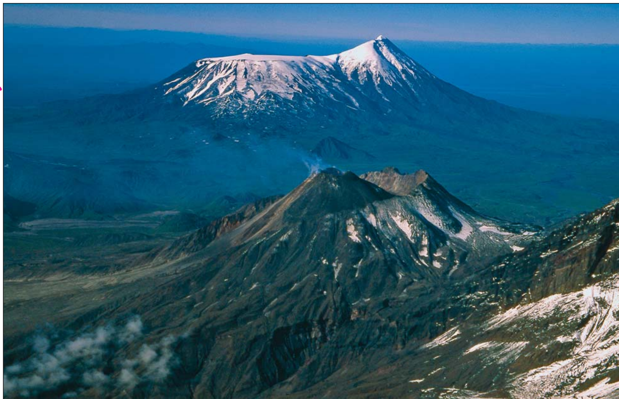
Рис.1. Вулкан Толбачик. Вид с севера. Новое извержение происходит на южном склоне Плоского Толбачика. На переднем плане — вулкан Безымянный с подковообразным кратером, знаменитый своим мощным обвалом и взрывом в 1956 г. В отличие от маловязких базальтов Толбачика, Безымянный извергает очень вязкие андезиты.

Здесь и далее (кроме рис.2) фото А.Б.Белюсова