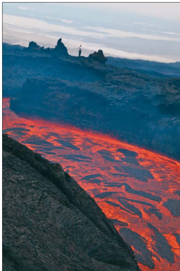
Рис.3. Река расплавленного базальта с температурой более 1000°C. 25 января 2013 г.

Казалось, что извержение должно скоро прекратиться, однако этого не случилось. В январе 2013 г. активность стала более ровной, сходной по характеру с Южным прорывом извержения 1976 г. [2]. Средняя высота выбросов вулканических бомб уменьшилась до 100 м. Лава перестала изливаться непосредственно из шлакового конуса, а начала вытекать через систему лавоводов — тоннелей в лавовом поле диаметром несколько метров и длиной 1—2 км. В их кровле образовалось несколько провалов — отдушин, из которых выходили раскаленные газы, а на глубине нескольких метров была видна быстротекущая лава (рис.4). Она выходила из тоннелей в виде протяженных лавовых рек глубиной 3—5 м (рис.5, 6)