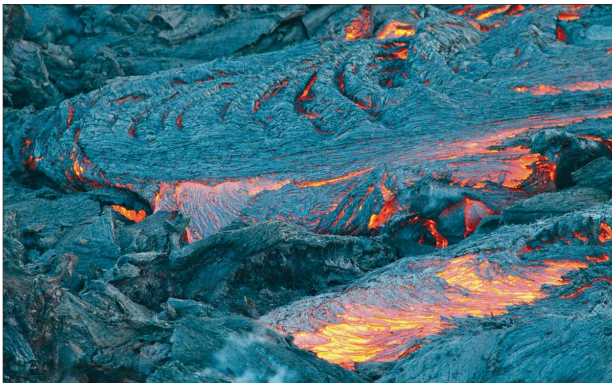
Рис.8. Канатная поверхность лавового потока типа «пахойхой». 8 апреля 2013 г.

и далее распространялась по склонам вулкана в виде потоков типа «аа» (рис.7). Лавовые реки часто тащили куски затвердевшего материала (обрушившейся кровли лавоводов, оторванные борта лавовых рек), которые иногда запруживали русло, что вызывало широкие разливы лавы, застывающей в форме «пахойхой» с канатной или кишечной поверхностями (рис.8).