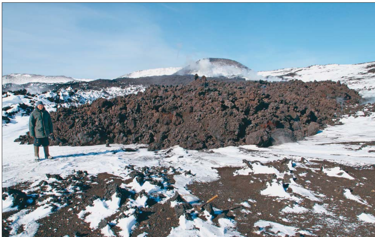
Рис.7. Фронт активно движущегося лавового потока типа «аа». 18 марта 2013 г.