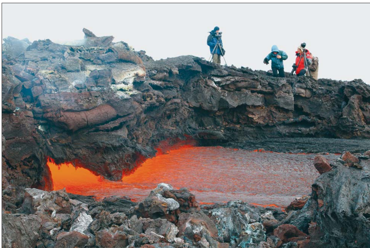
Рис.5. Выход лавового потока из основной лавовой трубы. 19 марта 2013 г.