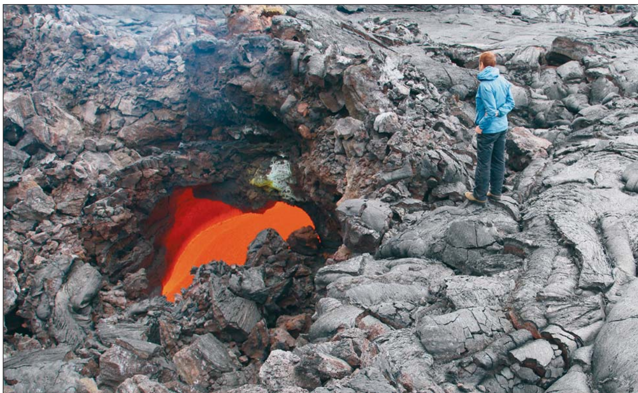
Рис.4. Провал в кровле лавовода с текущей лавой. 19 марта 2013 г.