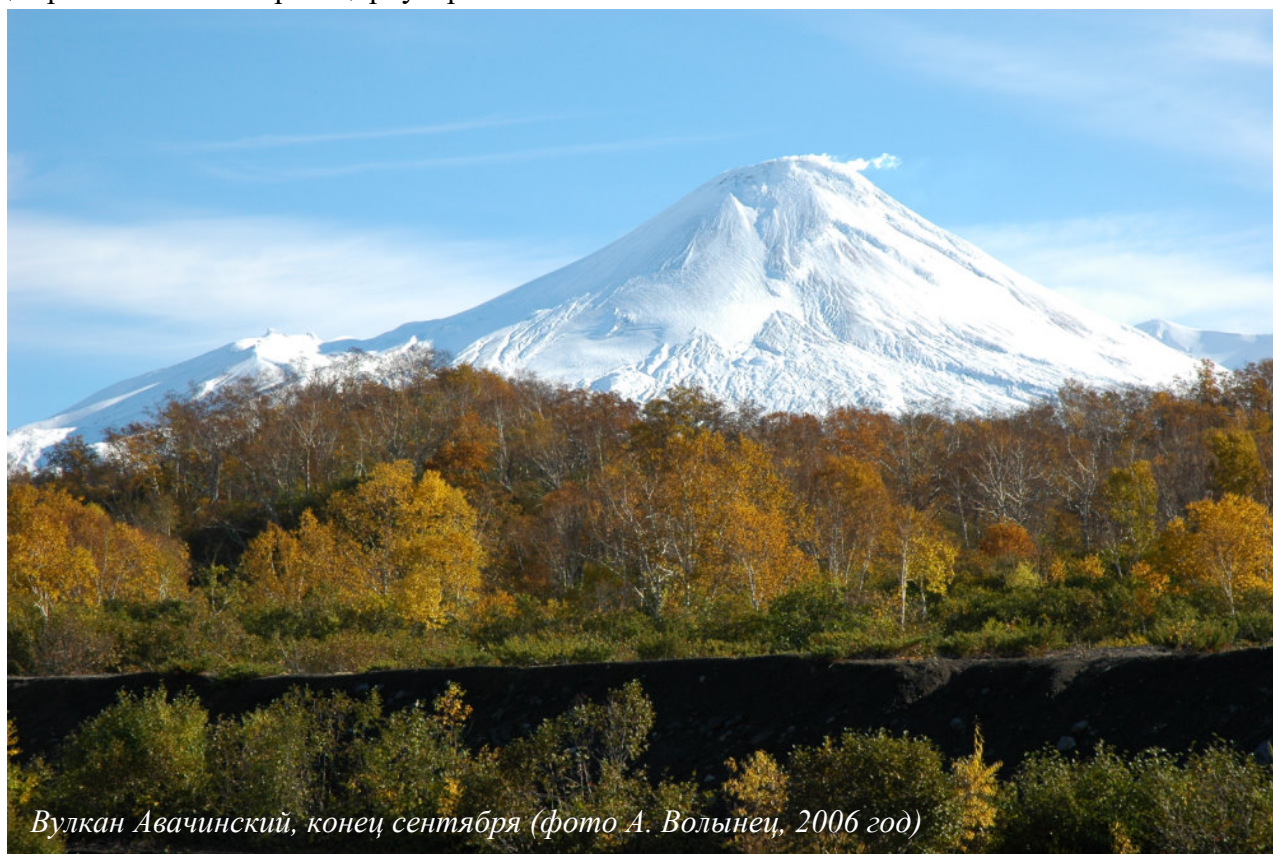
Вулкан Авачинский, конец сентября

В рамках конференции предполагается проведение однодневной геологической экскурсии на вулкан Авачинский, либо Горелый, либо Мутновский (в зависимости от погоды) с доставкой группы до подножия вулканов автотранспортом ИВиС и последующей пешей экскурсией. В районе вулканов в конце сентября уже ложится снег, поэтому рекомендуется иметь с собой теплую (зимнюю) одежду для участия в экскурсии. Более подробная информация об экскурсиях будет разослана во втором циркуляре.