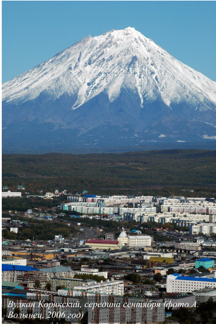
Вулкан Корякский, середина сентября (фото А. Вольнец, 2006 год)