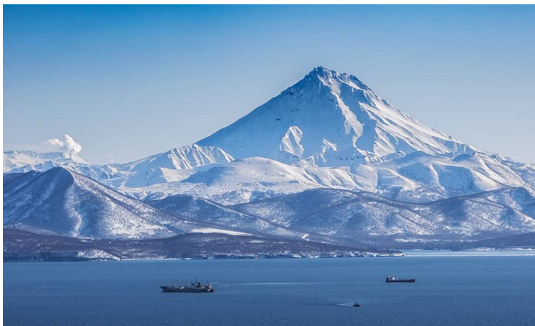
Южное обрамление Авачинской бухты. На заднем плане – Вилючинский вулкан (справа), Мутновский вулкан (слева). Вид с Никольской сопки

3. Бухта Лагерная . В скальных обрывах северо-восточного обрамления Авачинской бухты выходят на поверхность образования прибрежного вулканического комплекса миоценового возраста. Переотложенные вулканогенно-осадочные комплексы разного состава деформированы многочисленными разрывными нарушениями и дайковыми комплексами.