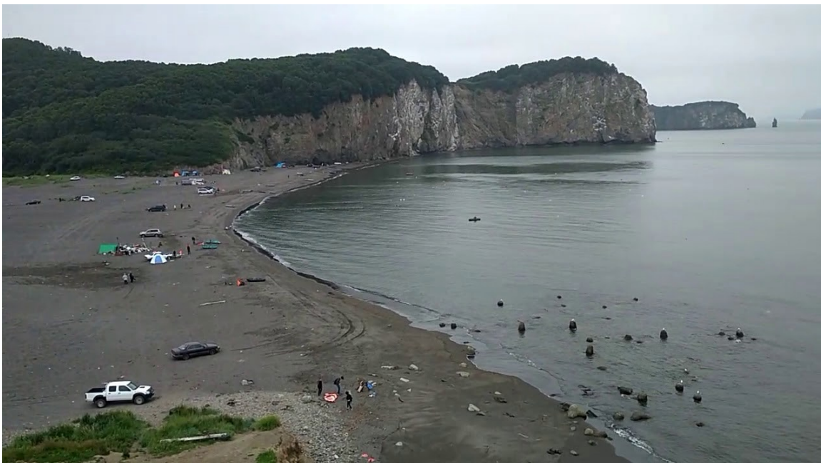
Береговые обрывы бухты Малая Лагерная

4. Смотровая площадка Петровской сопки. Отложения никольской толщи на Петровской сопке состоят из переслаивающихся отложений туфоалевролитов, туфов, кремнистых пород. Вскрытая мощность отложений в карьере Петровской сопки – около 300 м.