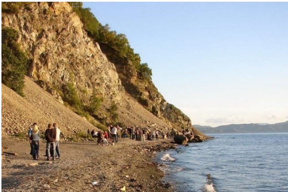
Обнажения Никольской сопки