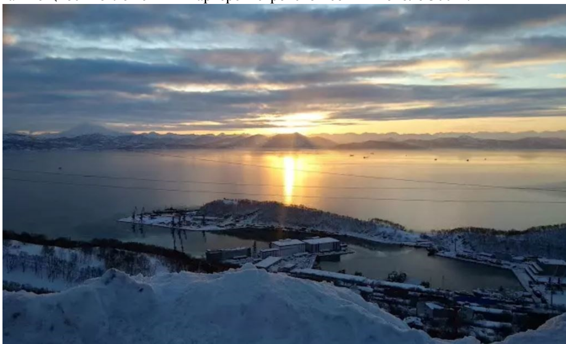
Вид со смотровой площадки Петровской сопки на Никольскую сопку и Авачинскую бухту

4. Смотровая площадка Петровской сопки. Отложения никольской толщи на Петровской сопке состоят из переслаивающихся отложений туфоалевролитов, туфов, кремнистых пород. Вскрытая мощность отложений в карьере Петровской сопки – около 300 м.