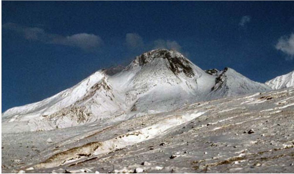
Вулкан Безымянный после извержения 1956 г. Вид с востока, 1994 г. Подковообразный кратер вулкана, образованный в 1956 г., заполнен куполом, формирование которого продолжается по настоящее время.

изошло извержение пирокластических потоков объемом 0.5 км 3 .